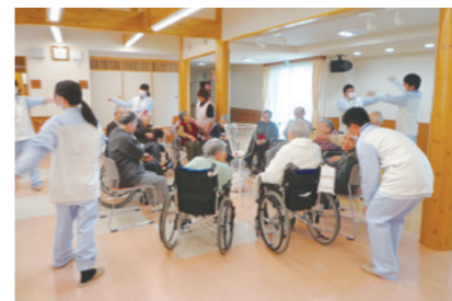
新入社員によるボランティア研修