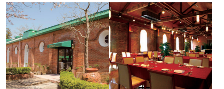
レストランキャノン

シャトーカミヤ公式サイト http://www.ch-kamiya.jp/ TEL.029-873-3151(代表)