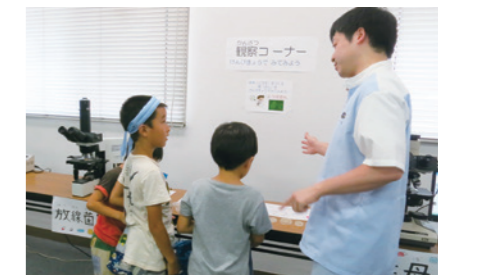
次世代育成支援「夏休み会社見学・体験会」を実施