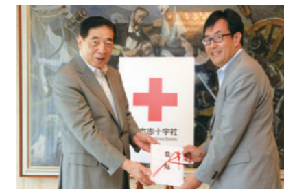
株主優待制度による日本赤十字社への寄付