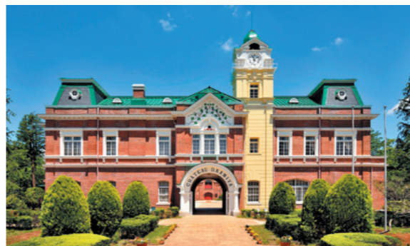
シャトーカミヤ本館

1903年(明治36年)に当社の創業者である神谷傳兵衛が茨城県牛久市に開設した、日本初の本格的ワイン醸造場。現在は、約6万平方メートルある敷地内に、ワインや地ビールをお楽しみいただけるレストランなどを展開し、ワインの歴史を紹介するとともに“食の楽しさ”をご提供しています。