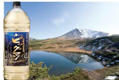
甲類焼酎「ビッグマンプレミアム」の販売を通じて北海道の環境保全活動に還元