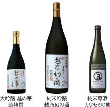
大吟醸 越の華 超特撰 純米吟醸 越乃幻の酒 純米原酒 カワセミの旅

事業内容 酒類・食品の製造販売 設立 1945年(昭和20年)4月23日 本社 〒012-8511 秋田県湯沢市深堀字中川原120-8 電話番号 0183-73-3106(代表)