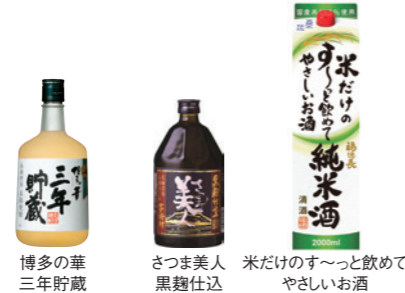
博多の華 三年貯蔵 さつま美人 黒麹仕込 米だけのす〜と飲みやすいお酒

事業内容 酒類・食品・酵素・医薬品の製造販売 設立 2003年(平成15年)7月1日 本社 〒104-8162 東京都中央区銀座6-2-10 電話番号 03-3575-2711(代表)