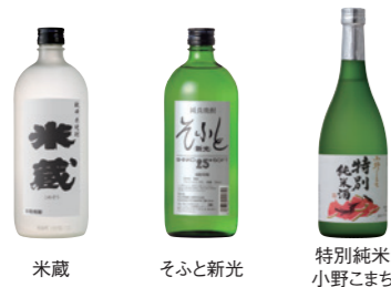
米蔵 そふと新光 特別純米 小野こまち

事業内容 酒類・食品の製造販売 設立 1951年(昭和26年)11月21日 本社 〒657-0864 兵庫県神戸市灘区新在家南町3-2-28 電話番号 078-802-7800