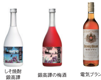
しそ焼酎 鍛高譚 電気ブラン