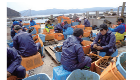
新入社員によるボランティア研修