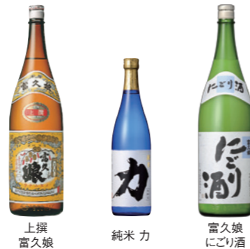
上撰 富久娘 純米カ 富久娘 にごり酒

事業内容 酒類・食品の製造販売 設立 1953年(昭和28年)7月1日 本社 〒271-0064 千葉県松戸市上本郷字仲原250 電話番号 047-315-5020(代表)