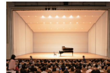
牛久市における文化芸術支援活動