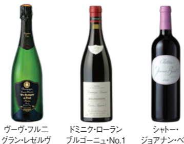
ヴァーヴフルニ グラン・レゼルヴ ブリュット・ブルミエ・クリュ ドミニク・ローラン ブルゴニュー・No.1 ショトー ジョアナン・ペロ

事業内容 酒類の製造販売 設立 1951年(昭和26年)6月14日 本社 〒950-0076 新潟県新潟市中央区沼垂西3-8-6 電話番号 025-241-2277